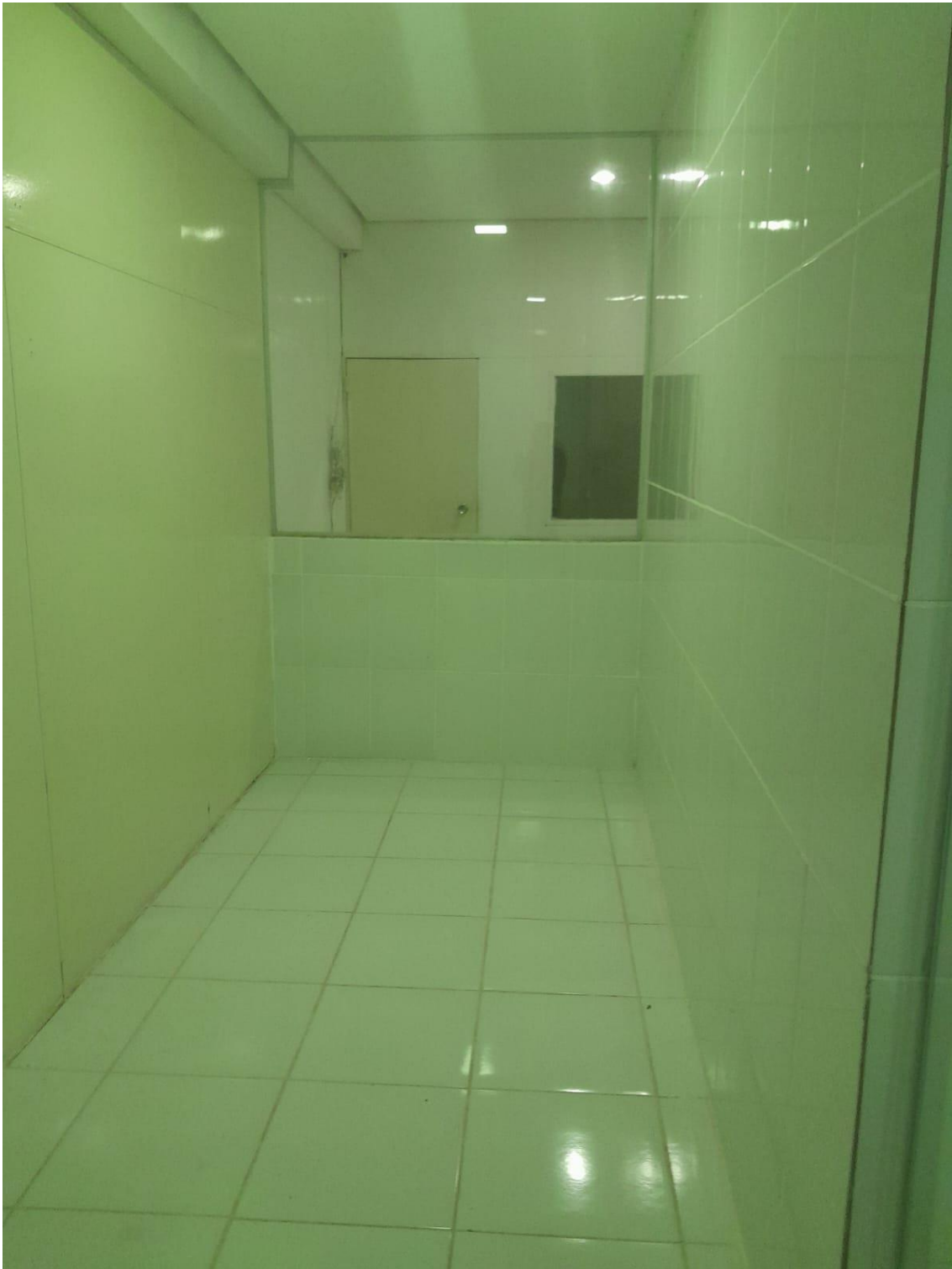
Figura 8 Sala de antigo laboratório desativado.