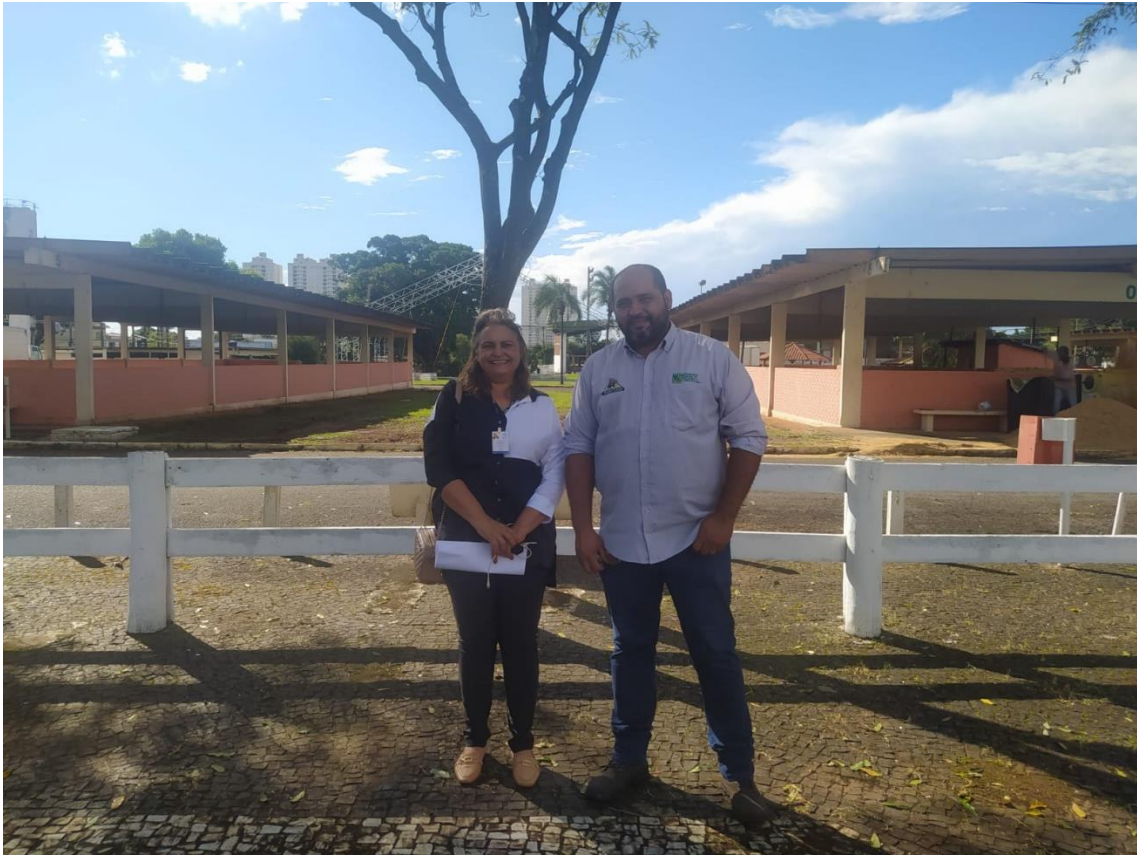
Figura 9 Coordenadora de Pesquisa Cotec e Representante da SGPA que acompanhou a visita.