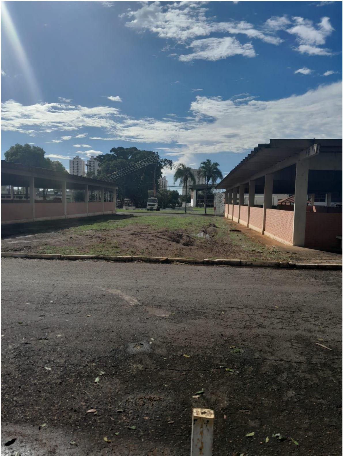
Figura7 Área disponível para execução de atividades ao ar livre na área de produção vegetal.