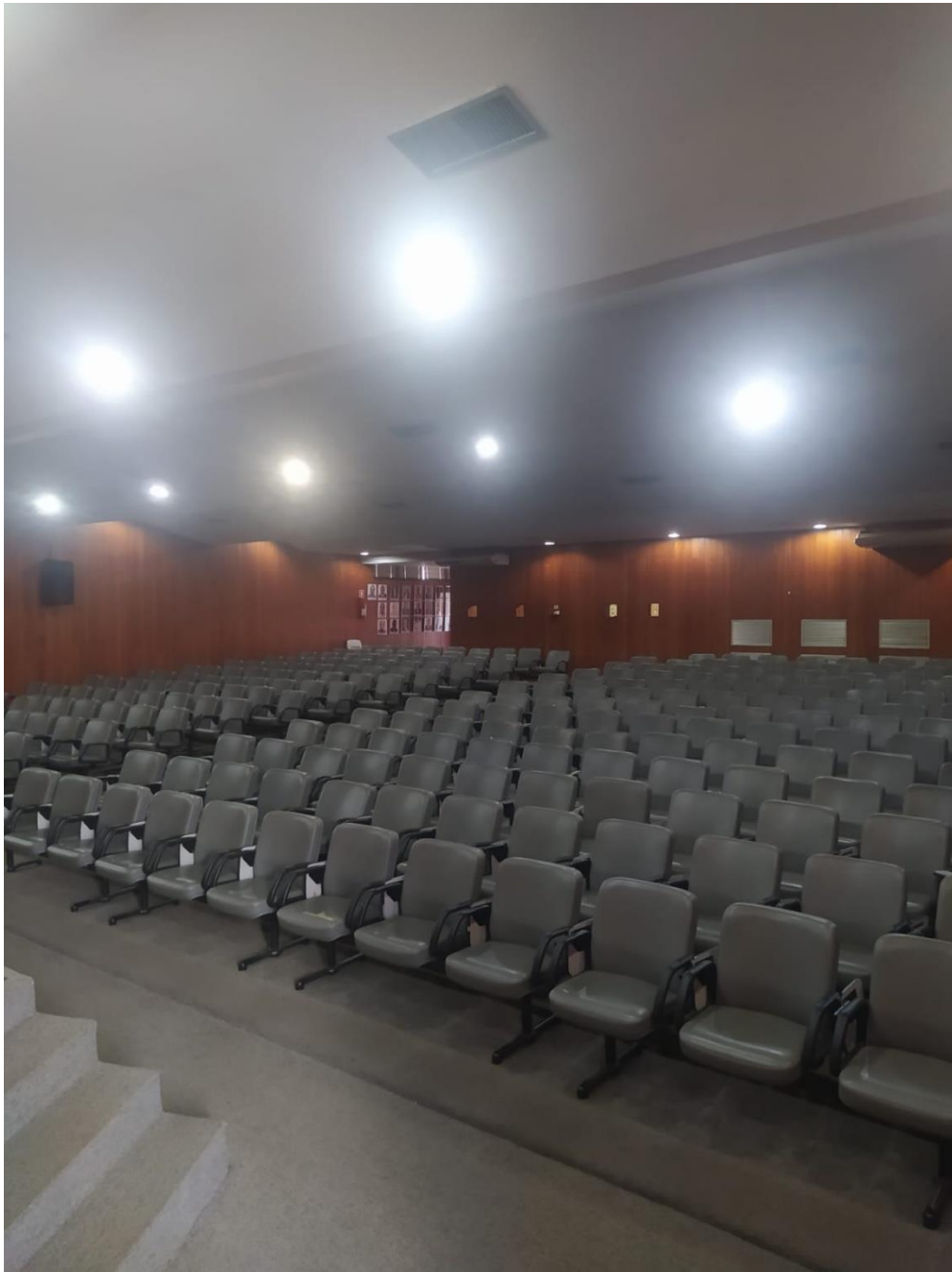
Figura 1 Auditório da SGPA com capacidade para até 270 pessoas sentadas.