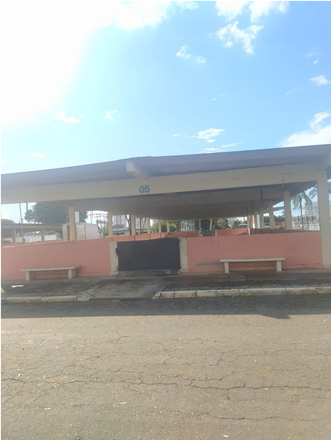
Figura 3 Baia na SGPA que pode ser utilizada para disciplinas da área da produção animal.