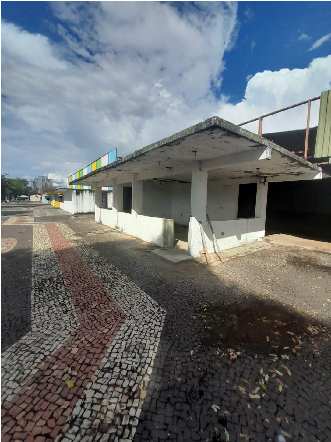
Figura 4 Fachada principal de um galpão que poderá sediar as instalações do curso técnico.