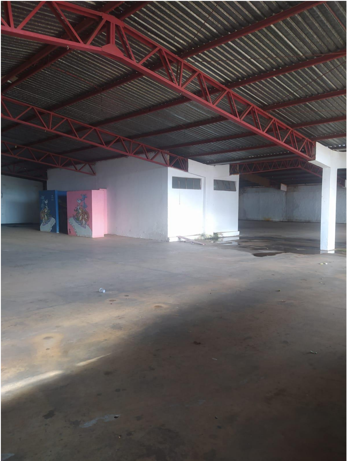
Figura 5 Vista do galpão com possibilidade de segmentação para abrigar estrutura do curso técnico.