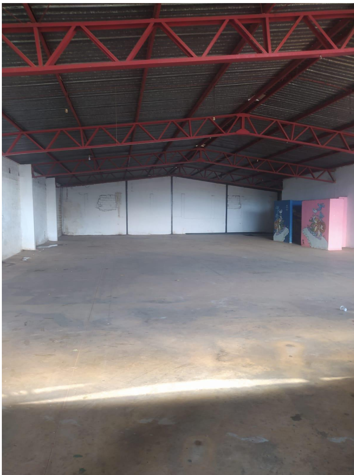
Figura 6 Vista do galpão com possibilidade de segmentação para abrigar estrutura do curso técnico.